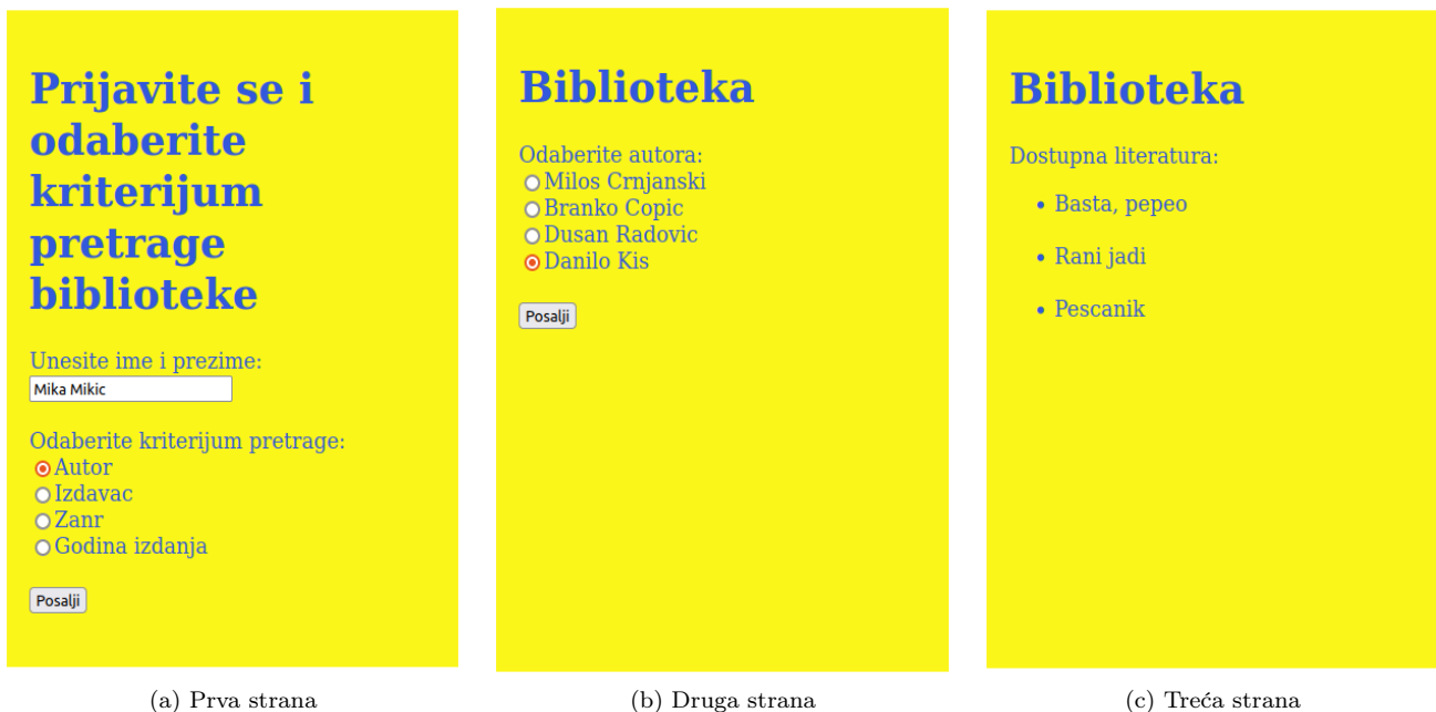
(a) Prva strana